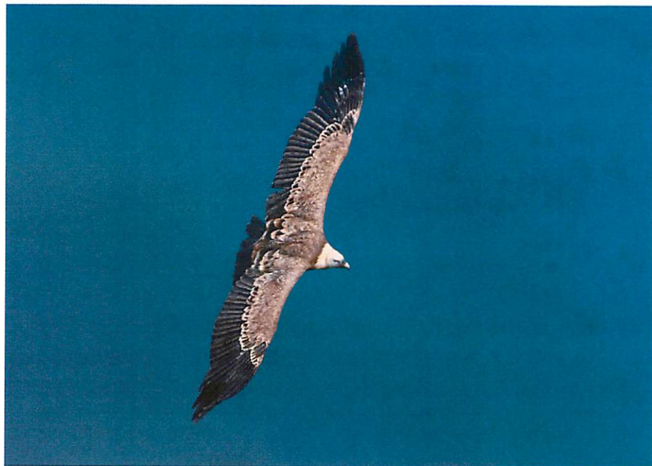
Beloglavi sup ( Gyps Fulvus )

Beloglavi sup ( Gyps Fulvus ) je retka vrsta orla - lešinara. Ova vrsta je ranije naseljavala šire područje zapadne Srbije, da bi sredinom 20.veka, usled ubrzane industrijalizacije, napustila sva staništa u zemlji. Samo zahvaljujući radu Rezervata Uvac, uz značajnu pomoć domaćih i inostranih organa vlasti i nevladinih organizacija, uspeo je ponovno naseljavanje (reintrodukcija) beloglavog supa u Rezervatu. U kontaktima sa nadležnima u Rezervatu dogovoreno je da JUBMES banka preuzme obavezu da ovoj instituciji pruža podršku doniranjem sredstava za plaćanje troškova goriva za vozila kojima se klanični otpad prenosi na hranilište beloglavog supa, za rad čuvarske službe i akcije čišćenja zaštićenog područja.