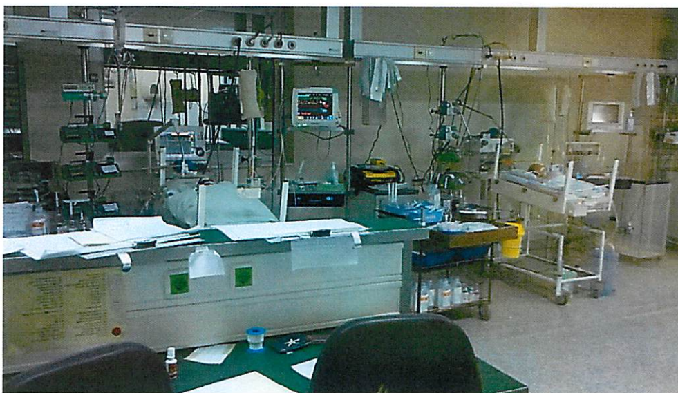
Institut „Dr Vukan Čupić“- Odeljenje dečje kardiohirurgije

Tokom izveštajnog perioda Banka je nastavila da podržava rad Humanitarne fondacije „Za dečje srce“, osnovane 1992.godine na inicijativu kardiohiruškog tima Instituta za zdravstvenu zaštitu majke i deteta Srbije „Dr Vukan Čupić“, čime je inicirano dugoročno partnerstva sa ovom uglednom ustanovom u neprofitnom sektoru. Tokom više od dvadeset godina rada, Fondacija je potvrdila svoje ciljeve i misiju stalnim aktivnostima usmerenim na prikupljanje pomoći radi kvalitetnijih uslova operativnog lečenja, rehabilitacije i socijalne adaptacije najmlađih pacijenata sa urođenim srčanim manama i njihovih porodica - nabavkom nužne medicinske opreme i aparata, pružanjem pomoći u edukaciji kadrova u oblasti dečje kardiohirurgije i drugih disciplina, kao i uključivanjem u programe prevencije i medicinskih istraživanja urođenih srčanih mana kod dece i sl.