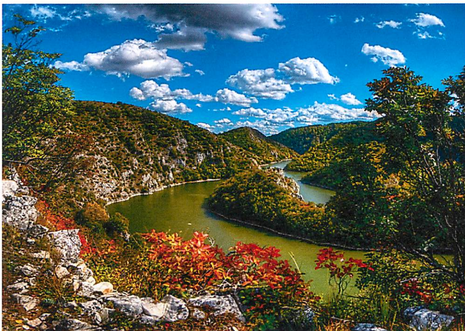
Klisura reke Uvac - meandri

Pored beloglavog supa, na ovom području nalazi se jedino gnezdište velikog ronca ( Mergus Merganser ) u Srbiji, kao i oko 100 različitih drugih vrsta ptica, 11 vrsta riba i preko 200 biljnih vrsta (taksona), što govori o veoma izraženom biodiverzitetu ove teritorije.