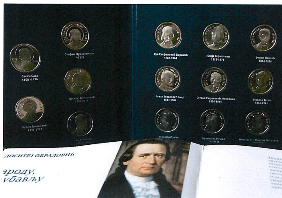
Album sa kovanicama "Znamenite ličnosti Srbije"

7. Banka je nastavila da doprinosi unapređenju znanja i obrazovanja, kao važnih preduslova održivog razvoja. U tom smislu podržali smo akciju izdavačke kuće "Politika" i Ministarstva prosvete za nagrađivanje najboljih učenika generacije u srednjim i osnovnim školama dodeljivanjem nagrada albuma sa kovanicama „Znamenite ličnosti Srbije”. Ovim se mladom naraštaju približava vredno kulturno, umetničko, naučno i duhovno nasleđe naše zemlje i promoviše kultura kao determinanta nacionalnog kulturnog identiteta. Nacionalna kultura se afirmiše i kao element integracionog procesa. Kulturni aspekt integracionog procesa je neposredno povezan i sa pitanjem identiteta kao otvorene kategorije. Promocijom vrhunskih vrednosti nacionalne kulturne baštine podstiče se razvoj kulturne različitosti evropskih naroda i obogaćuju zajedničke vrednosti koje čine osnovu evropskog kulturnog prostora i kulturnog identiteta.