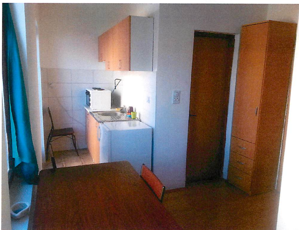
Centar za socijalni rad "Sava Ilić", Arandjelovac: "Kuća na pola puta"

Imajući u vidu ovakve vrednosne ciljeve, podržali smo projekat „Kuća na pola puta“ Centra za socijalni rad „Sava Ilić“ u Arandjelovcu, donirajući sredstva za opremanje jedne stambene jedinice koju je lokalna samouprava dodelila Centru. Osnovni cilj projekta je zbrinjavanje punoletne stambeno neobezbeđene dece, koja sticanjem punoletstva ili završetkom školovanja, izlaze iz sistema socijalne zaštite (domova za decu bez roditeljskog staranja, ili hraniteljskih porodica). Centar za socijalni rad prati proces njihovog osamostaljivanja. Za vreme boravka mladih osoba u pomenutom prostoru, lokalna samouprava pokriva troškove komunalija, a organ starateljstva obezbeđuje odgovarajuću novčanu pomoć, do zaposlenja štićenika/štićenice, odnosno do sticanja mogućnosti da plaćaju svoje troškove.