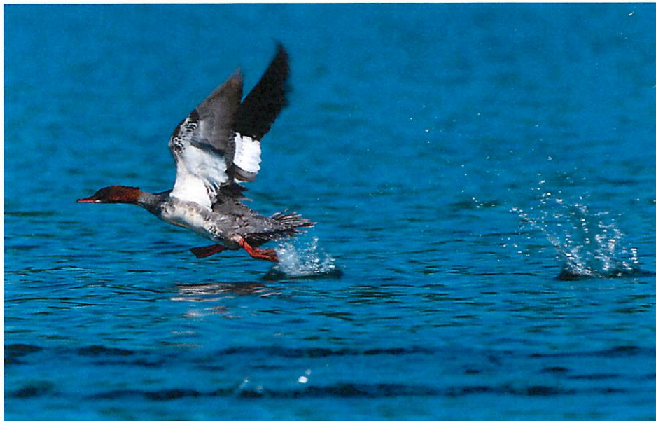
Veliki ronac ( Mergus Merganser )

području Rezervata. Napominje se da je za ove namene ranijih godina Rezervat uživao donaciju jedne evropske vlade.