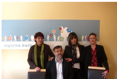
Izgradnja Sigurnih kuća u opštinama širom Srbije