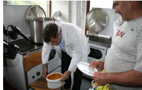
Pomoć najsiromašnijima. Akcija Hrana za sve .

Ostale aktivnosti B92 bile su vezane za teme koje predstavljaju kontinuitet ranijih aktivnosti B92 iz prethodnih godina: