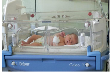
Kupovina preko 100 inkubatora za porodilišta širom Srbije. Akcija Bitka za bebe